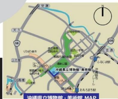
沖縄県立博物館・美術館 MAP