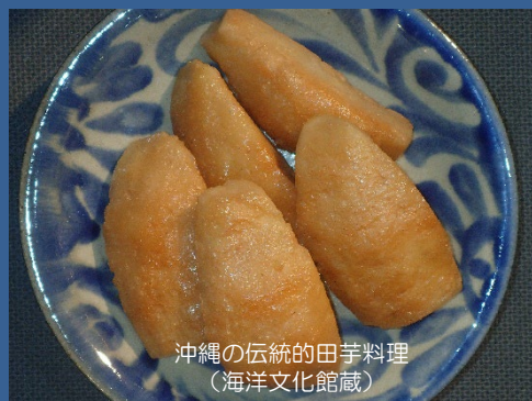
沖縄の伝統的田芋料理

沖縄の自然環境や文化について、より多くの方々へ伝えるため、こどもから大人まで楽しみながら学べる講座を開催しています。みなさんのご参加をお待ちしております。