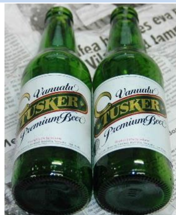
バナアツのビール （海洋文化館の展示品）