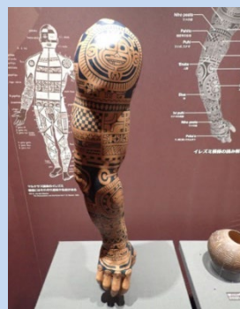
マルケサス諸島のタトゥー模型 （海洋文化館の展示品）