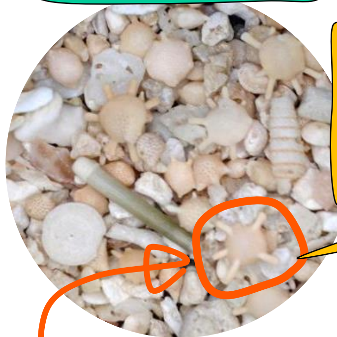
すな はま 砂浜の砂