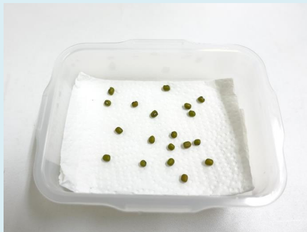
タッパーなどにキッチンペーパーをひいて水で湿らしたら種をまこう。 （実験方法①）