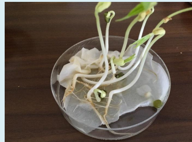
うまいくともやしができます。どうやったらきれいなもやしができるか、考えよう。