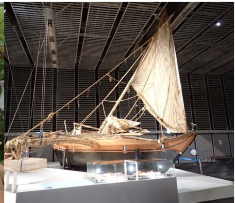
ミクロネシアの大型カヌー