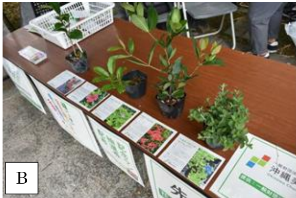
写真-10 圃場内で生産した苗木の活用. A 海洋博公園内における苗木の無人販売(熱帯・亜熱帯都市緑化植物園). B 沖縄県都市緑化祭における苗木無料配布(那覇市松山公園)