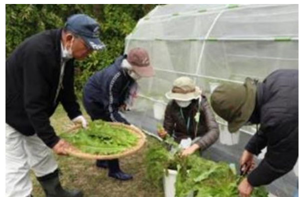
写真-9 伝統野菜メーオーパの収穫体験（熱帯・亜熱帯都市緑化植物園）