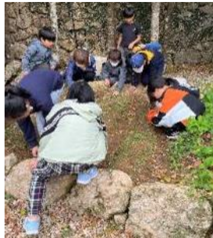
写真-8 在来野菜コレクションの‘もとぶ香ネギ’を用いた栽培体験（おきなわ郷土村あたいぐわ）

在来野菜研究に使用している在来チシャ（メーオーパ）は県内でほとんど知られていないため、普及啓発を兼ねて収穫体験を実施した（写真-9）。