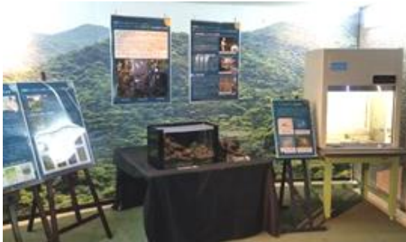
写真-6 やんばるギャラリーにおける沖縄の希少植物・域外保全を行っている植物の展示