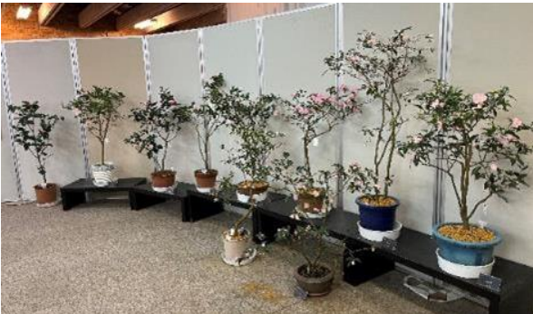
写真-5 「ツバキ展」における財団保有植物の展示（熱帯ドリームセンター）