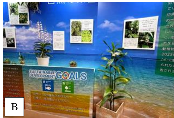
写真-11 特別企画展「南西諸島の野生らん展」における財団保有植物・パネルの協力展示(世界らん展-花と緑の祭典-)。野生ランの展示(B)。