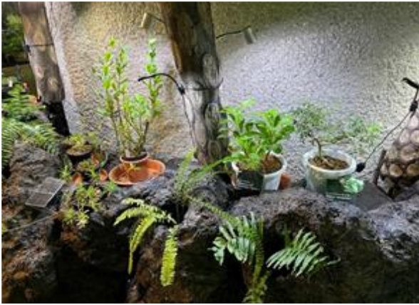
写真-4 「牧野富太郎展」で展示した牧野博士が命名に関与した沖縄の植物（やんばるギャラリー）