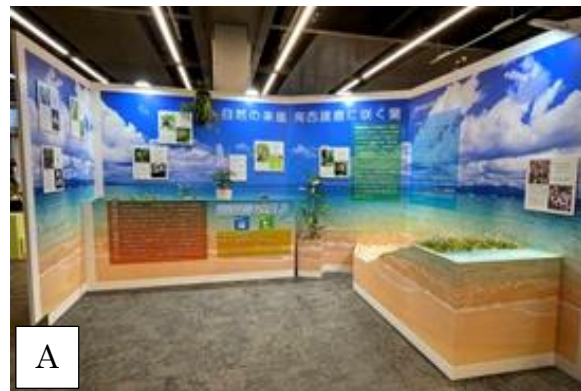
写真-11 特別企画展「南西諸島の野生らん展」における財団保有植物・パネルの協力展示(世界らん展-花と緑の祭典-)。展示全景(A)

世界らん展における南西諸島の野生らん展示の依頼を受け、東京ドームシティプリズムホールで開催された特設コーナーに財団保有株を貸与し展示した(写真-11)。