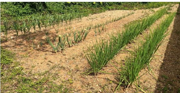
写真-1 在来 Allium 属野菜類の栄養繁殖保存栽培（第二熱帯試験圃場）

南西諸島における希少植物の生息域外保全に関する研究、花卉類または観葉植物等の新品種開発、南西諸島在来野菜の収集および生理生態に関する研究、並びに都市緑化木の病虫害防除に関する研究に試験圃場保有植物を活用した（写真-1, 2）。