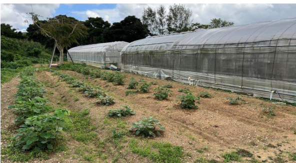
写真-2 芋麻優良系統を供試材料とした施肥試験（第二熱帯試験圃場）