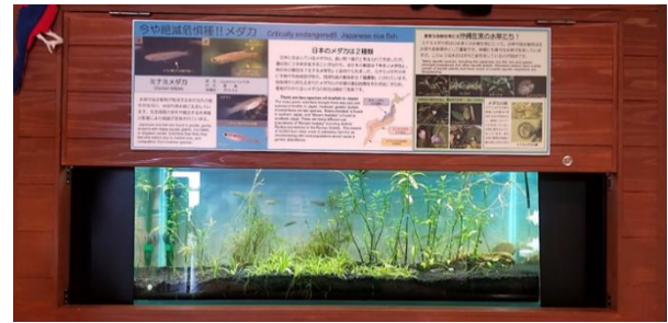
写真-7 新規に設置した在来メダカ展示水槽における沖縄産水草の展示（沖縄美ら海水族館）

沖縄美ら海水族館内では在来淡水魚の展示も行っている。その水槽に、当財団が保有する在来水生植物を新規に展示し、陸水生態系の普及啓発に活用している（写真-7）。