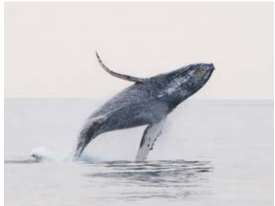
ブリーチするザトウクジラ

当財団では、繁殖海域の一つである沖縄周辺海域において、1991年から約30年に亘り、来遊状況等の野外調査を実施してきました。ザトウクジラは尾びれの模様や形状が個体毎に異なるため、尾びれ写真による個体の識別が可能です。これらの特徴をもとに、ロシアやフィリピンの研究組織と共同研究を実施した結果、これまでにロシア-沖縄間で計69個体、