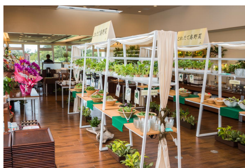
レストラン「美ら島キッチン」