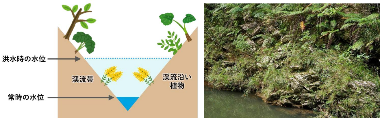
図 1. 河川断面における溪流帯の位置（左）と沖縄島やんばる地域に形成された溪流帯の植生（右）。

溪流沿い植物が誕生する背景としては、もともと川から離れた環境に分布していた祖先種が洪水にともなう自然選択を受け、次第に形や性質を変化させて溪流沿い植物に進化したと考えられています。植物は光合成によって自活する生物のため、洪水がない環境では幅広い葉をつけた方が光を多く受け取り、生き残るうえで有利になるはずですが。しかししばしば洪水に見舞われる溪流帯で幅広い葉をもっていたらどうなるでしょうか？きつと強い水の抵抗を受けて葉は引きちぎられて、植物は大きなダメージを受けてしまうことでしょうか。このように溪流帯環境では、幅広い葉をもつ個体よりも水流を受け流せる細い葉をもつ個体が有利となり、時間経過とともに溪流沿い植物として祖先種から独立していくものと考えられます。