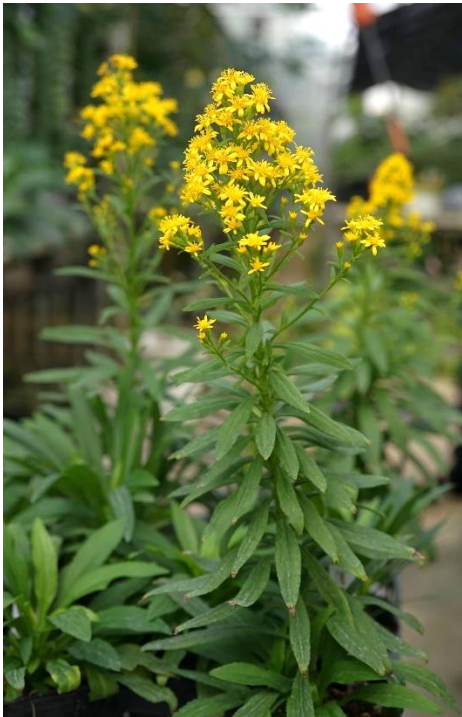
図 3. 一般財団法人 沖縄美ら島財団で生息域外の圃場で保全栽培されているヤンバルアオヤギバナ。

このやんばる地域の固有種・ヤンバルアオヤギバナは、沖縄島内でも限られた河川にしか分布していません。過去にはダム建設のために自生地が水没し個体群が壊滅した事例もあり、沖縄県では絶滅危惧 IA 類（野生個体群が残る種のなかでは最も危機的な状況にある種）に指定される希少種となっています。しかしこれまでは本土のアオヤギバナと同種だと考えられてきたため、国レベルでの絶滅危惧種には指定されていない状況にあります。本研究によりヤンバルアオヤギバナの独立性が明らかになったことから、今後は本種の希少性評価を再検討する必要があると考えられます。本種はやんばる地域の多雨環境と急峻地形が生み出した貴重な自然遺産として、当地の溪流帯の環境とともに大切に守っていくべき生物です（図 3）。