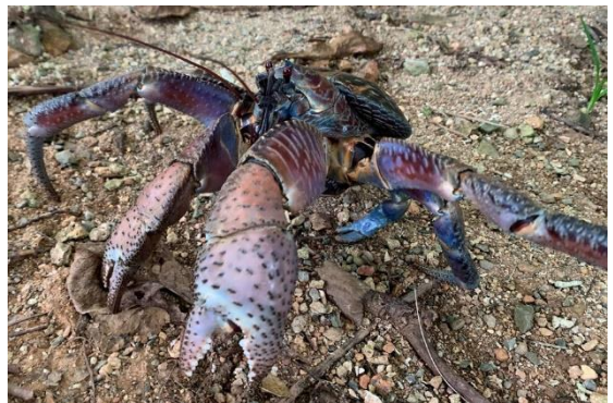
海洋博公園に生息するヤシガニ

当財団で 2006 年から実施してきた海洋博公園に生息するヤシガニの生態調査では、甲殻の紋様パターンが脱皮を経ても変化しないという特徴から個体識別が可能であることを 2015 年に明らかにしました。研究結果から生態情報の追跡が可能となり、2019 年までの 14 年間で 350 回以上の追跡調査を実施、506 組の再捕獲データを収集しました。