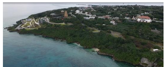
海洋博公園にはヤシガニの生息域に適した海洋樹林が保たれています