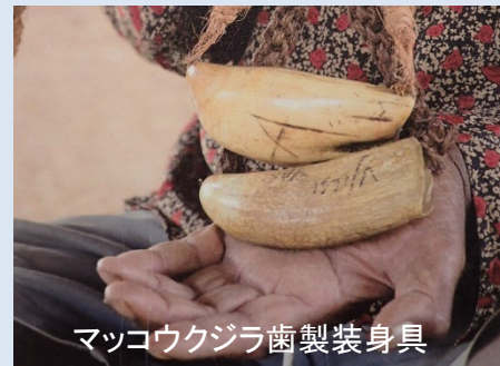
マッコウクジラ歯製装身具